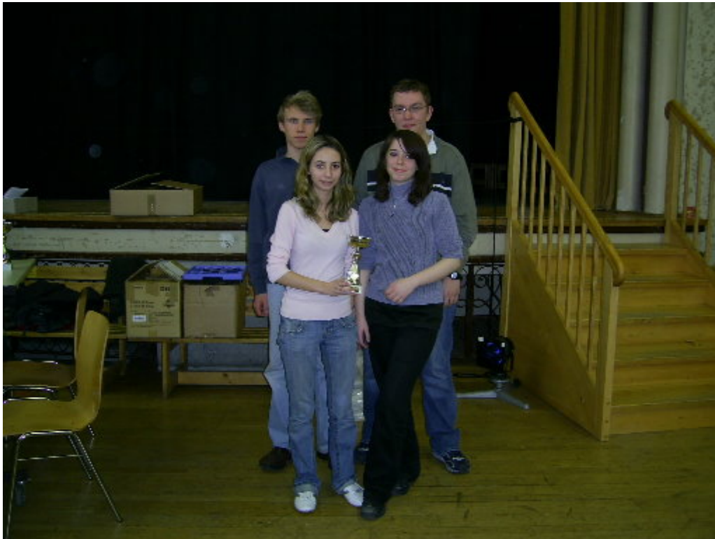
Sieger Wertungsgruppe A: SG Grün-Weiß Dresden I