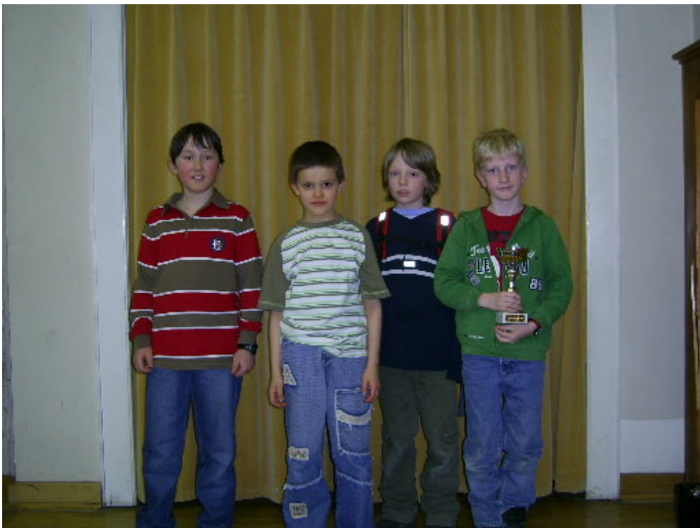
Sieger Wertungsgruppe C: Grundschule Grumbach