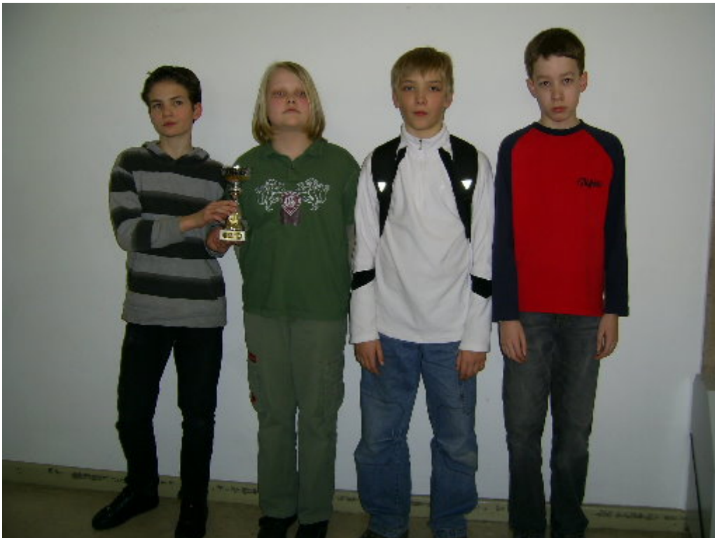
Sieger Wertungsgruppe A: SV Dresden-Striesen I