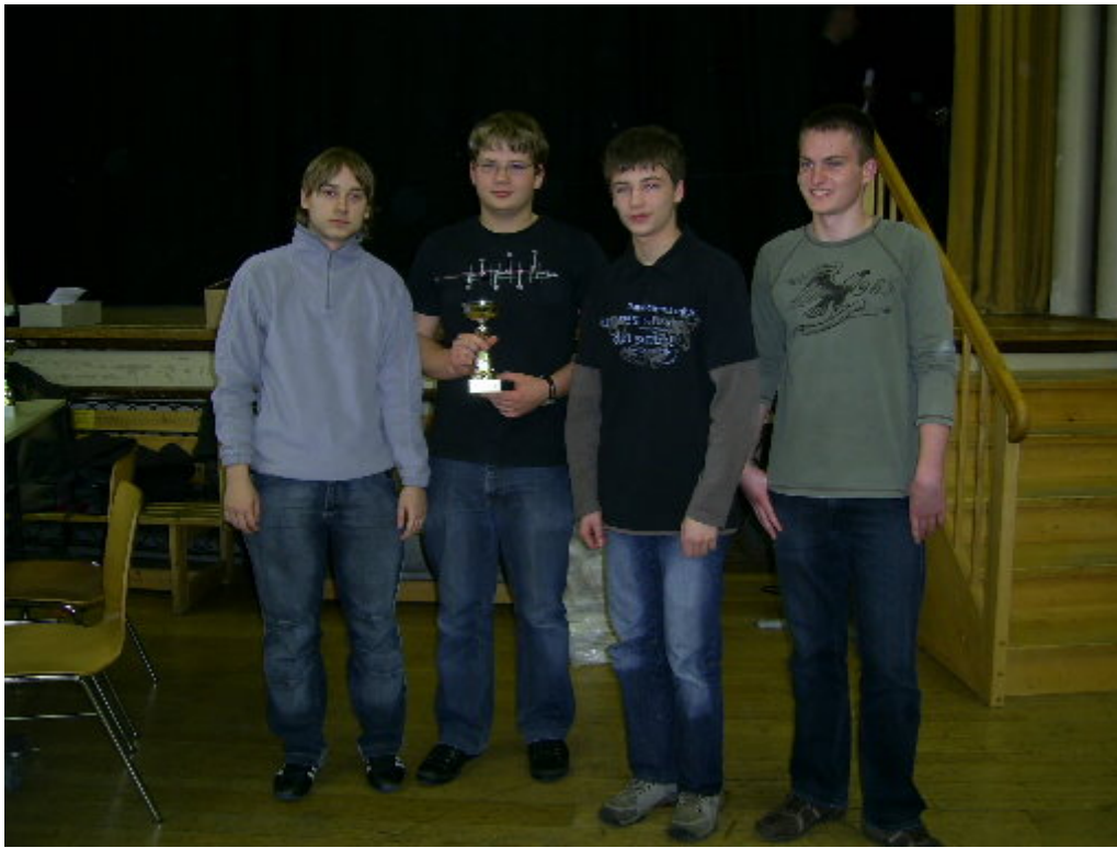
Sieger Wertungsgruppe B: Vitzthum-Gymnasium Dresden