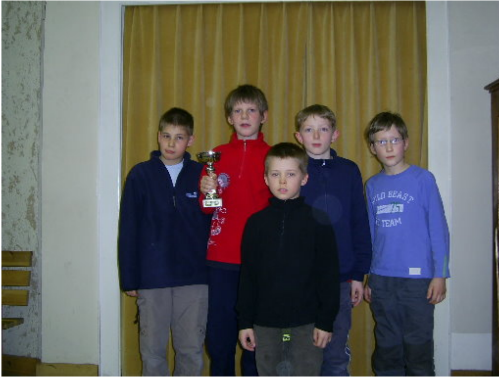
Sieger Wertungsgruppe B: 59. Grundschule Dresden