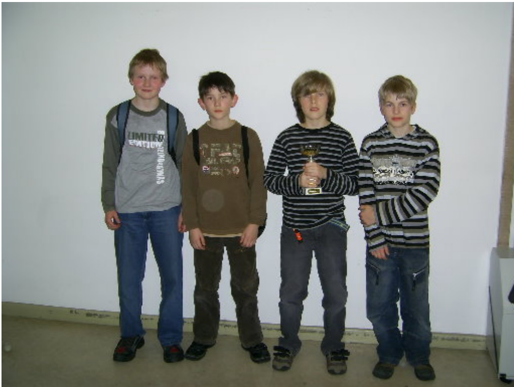
Sieger Wertungsgruppe C: Vitzthum-Gymnasium Dresden