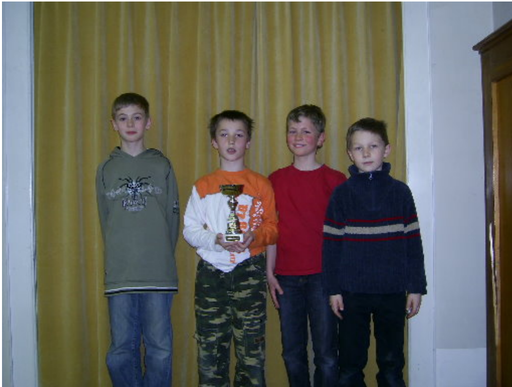
Sieger Wertungsgruppe A: Schach macht fit I