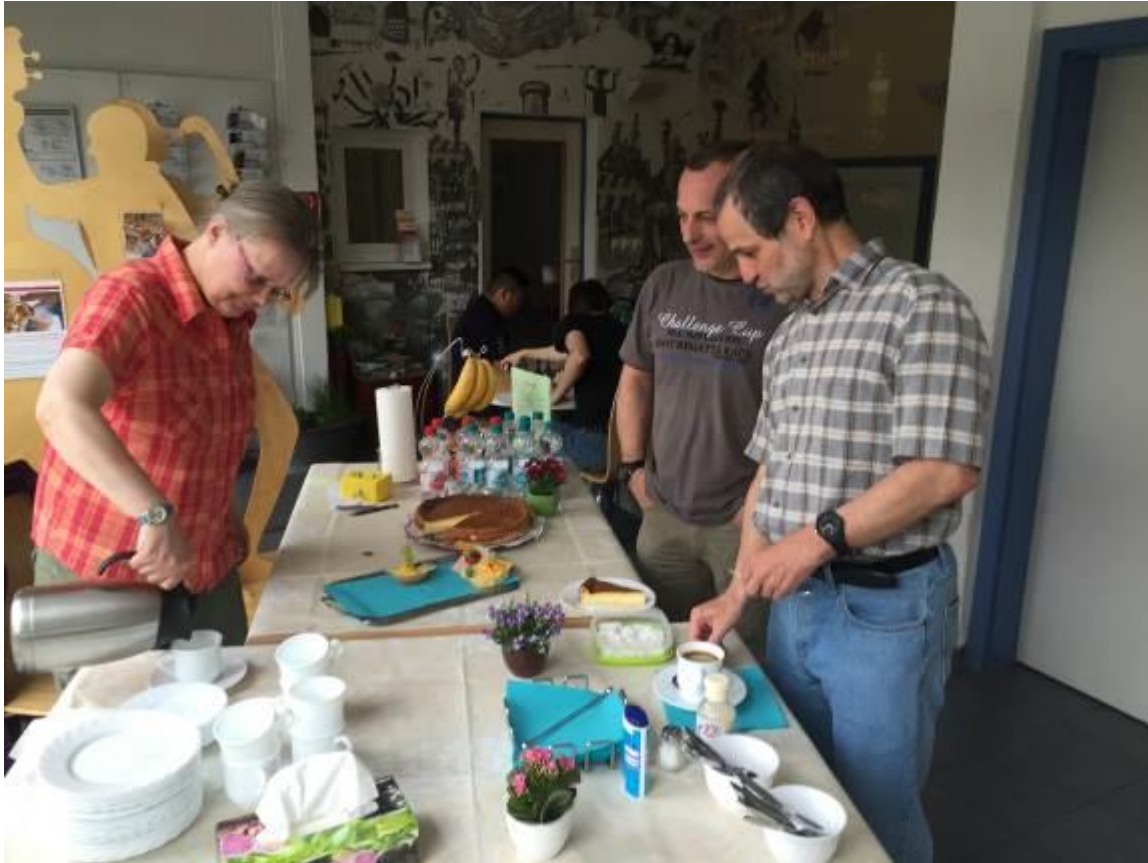
Ein Blick auf unseren Cateringbereich