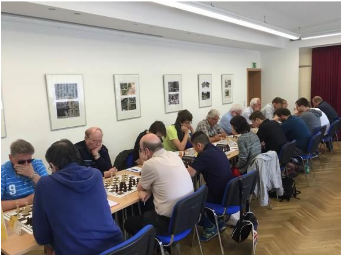
Hier ein Blick auf das offene Turnier.