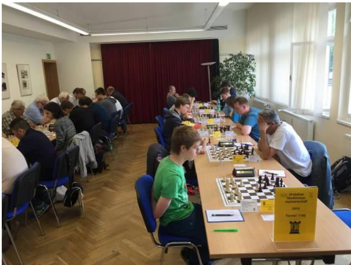
Ein kurzer Blick in den Turniersaal zu Beginn der sechsten Runde.