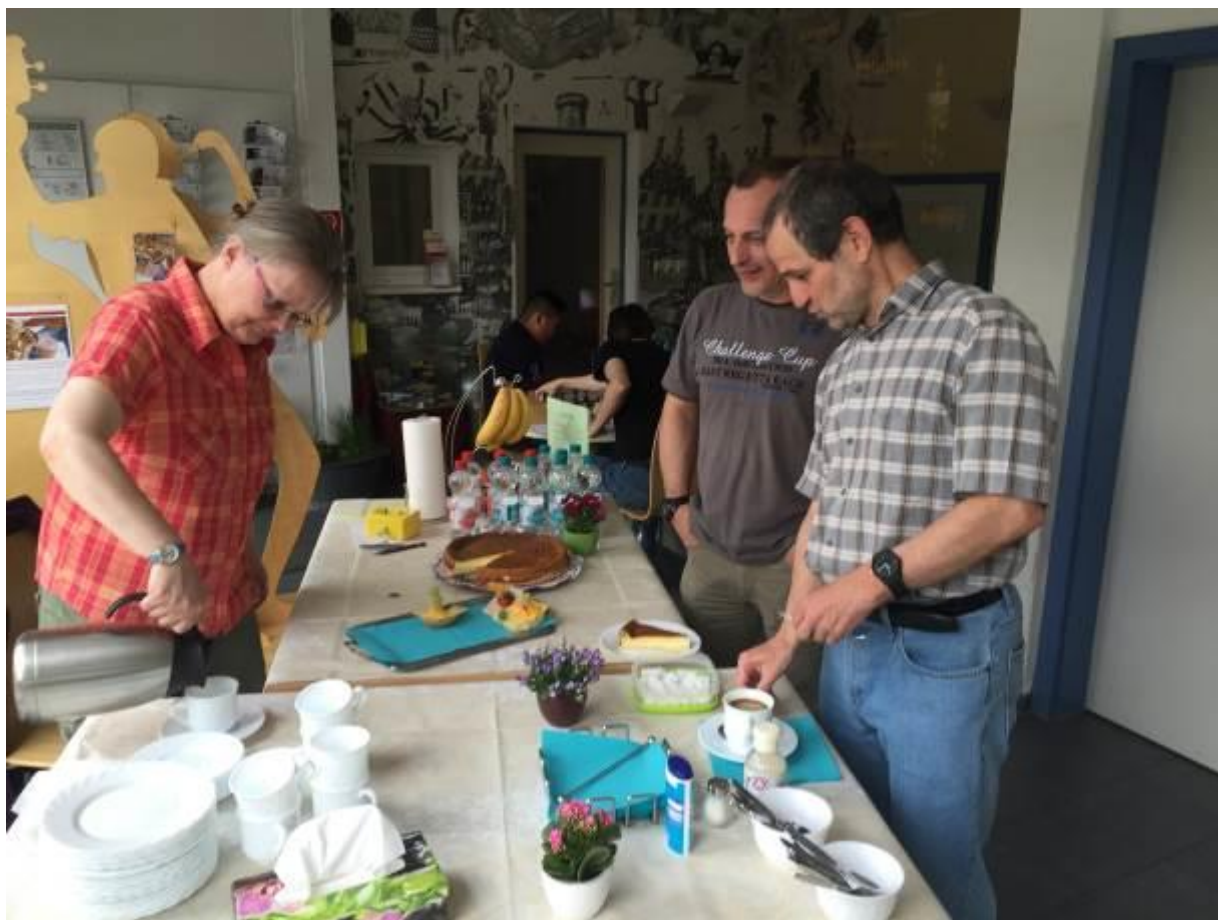
Ein Blick auf unseren Cateringbereich