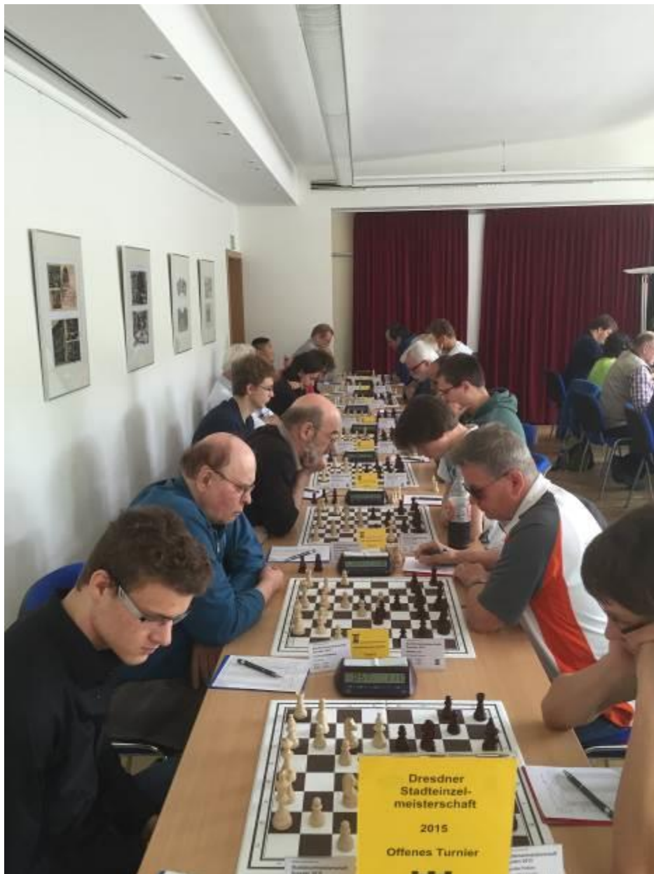
Hier ein Blick auf die nach oben offene Gruppe

Hervorzuheben ist in der Runde die Anzahl der Remisen, die für eine erste Runde ungewöhnlich sind sowie die Siege der vermeintlich schwächeren Gegner an den Brettern 3, 4 und 7. Die erwarteten Ergebnisse gab es so nur an einem Drittel der Bretter.